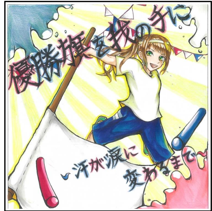
イラスト 2年2組 日向 楓花

【日 時】 令和2年9月12日(土) *雨天 13日(日)に順延 花 火 6:10 開会式 8:30 生徒登校 8:20 競技開始 8:40 閉会式 11:50 【場 所】 富良野西中学校 グラウンド